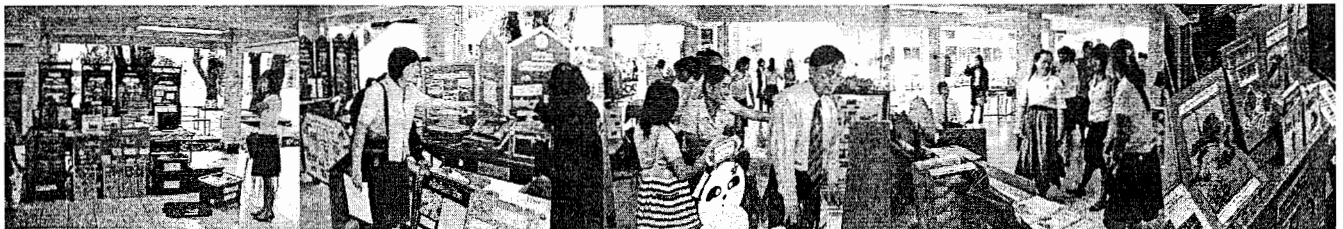
อาจารย์นิเทศก์ และคณาจารย์ ชมนิทรรศการ สื่อของนักศึกษา