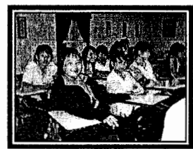
ฝ่ายบริการช่วยเหลือระยะแรกเริ่ม (EI) ศูนย์การศึกษาพิเศษ : ข่าว