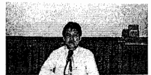
อ.ภักพล ชี้แจงการสัมมนา