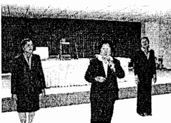
อ.ดวงนภา และคณะวิทยากร