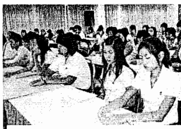
นักศึกษาที่เข้าร่วมการอบรม