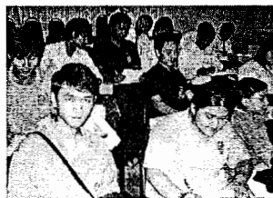
นักศึกษาชั้นปีที่ ๓ ที่เข้าร่วมสัมมนา