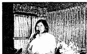
ผศ.ชญานิชฐ์ กล่าวสรุป